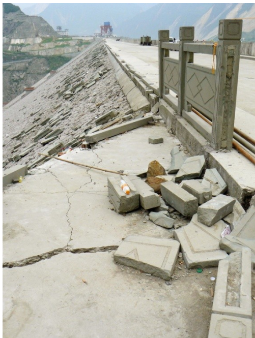
г. Красноярск 2022